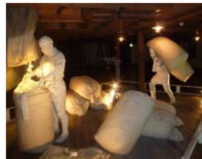
当時の蔵出しの様子