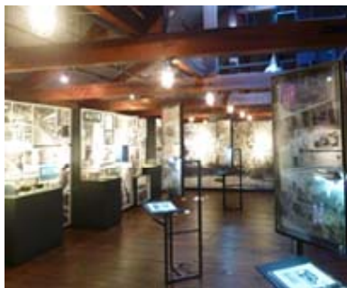
メモリアルギャラリー