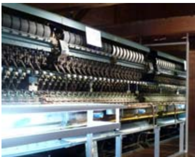
実際に使われていた機械